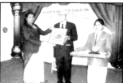
English Speaking Skill