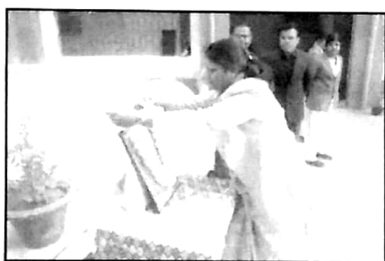
Swami Vivekanand Jayanti