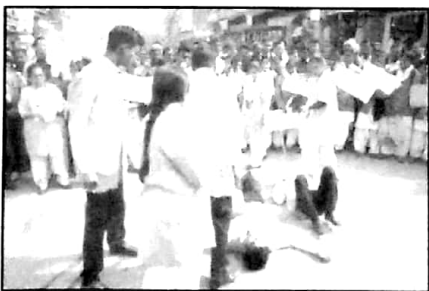
Nukkad Natak on Traffic Awareness Programmmme