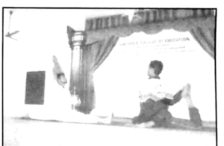
Yoga Training by Dev Sanskriti